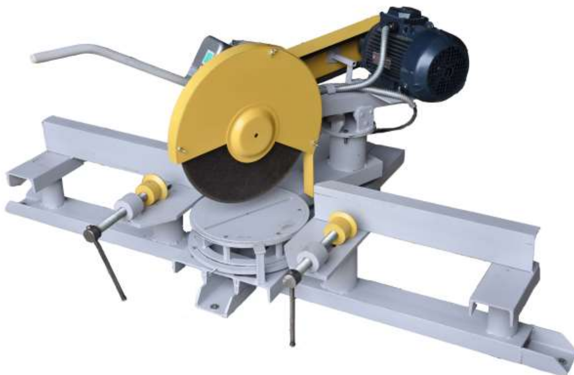
Станок СОП-400 с поворотной головкой 5,5кВт

Станок абразивно-отрезной поворотный СОП-400 предназначен для резки металлопроката под углом , с помощью абразивных кругов изготовленных по ГОСТ 21963-82.